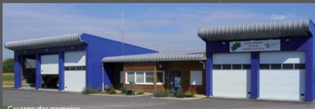
Caserne des pompiers