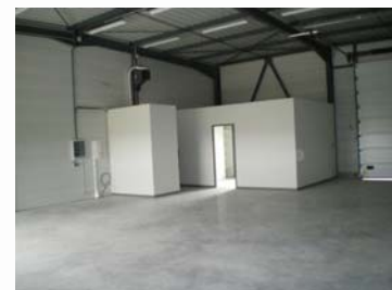
Photo intérieur type