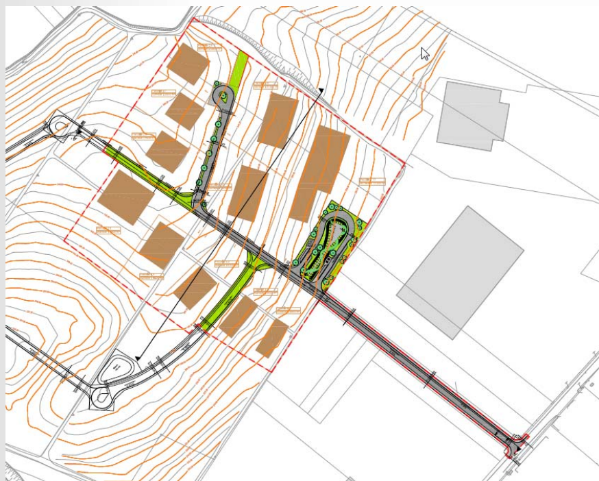
PLAN D'AMENAGEMENT DE LA ZA LES PLANTES