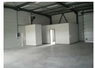
Photo intérieur type